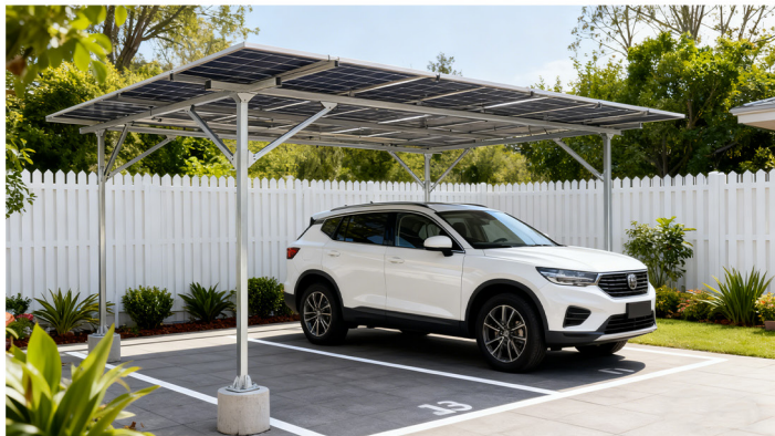
家庭私家车位场景