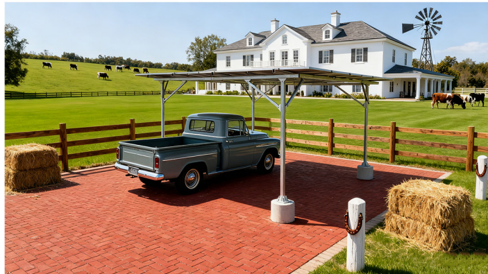
农场庄园停车区域场景