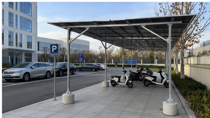
办公园区车棚场景