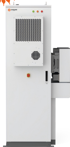
30kW/63kWh 户用混合储能集成柜