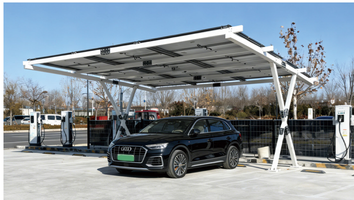
公共充电站点场景