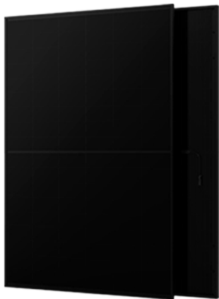
n型BC双玻纯黑光伏组件